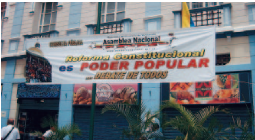
Le "pouvoir populaire" : un moyen de diffuser les idées et les hommes de Chavez.

Manière d'entériner une politique déjà passée dans les faits : il est déjà acquis que deux officiers qui se parlent doivent d'abord se saluer en lançant rituellement : "Le socialisme, la patrie ou la mort". Un copié-collé venu du castrisme. Ajoutons qu'elle aurait une posture de résistance populaire. Manière