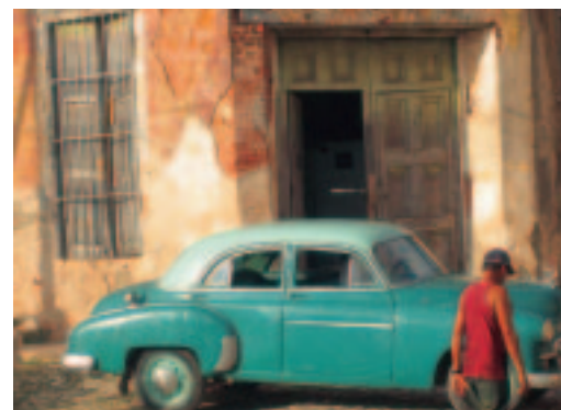
Des voitures du temps de Batista.

Pourtant, sauf Raul Castro, désigné par son frère aîné mais n'occupant