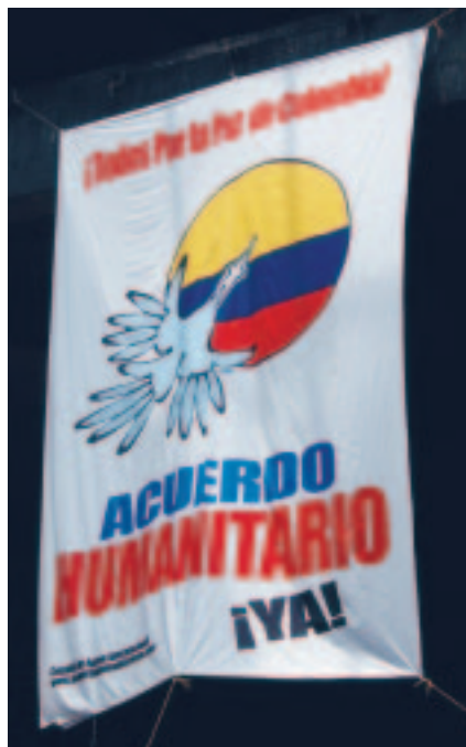
Affiche de soutien aux initiatives de Chavez en faveur de la libération des otages des Farc.

Si Chavez reste d'abord un homme pragmatique et un bon tacticien, ses conseillers sont très marqués par les "bricolages idéologiques" post-léninistes. Il s'agit pour eux de justifier la main mise par les partisans du "socialisme bolivarien" sur l'ensemble du pays. Les discours qui nous ont été tenus sont un salmigondis castriste et marxiste-léniniste, avec quelques pincées de Gramsci (pour justifier l'occupation progressive de l'espace culturel), voire de "conseillisme" anarchisant, c'est-à-