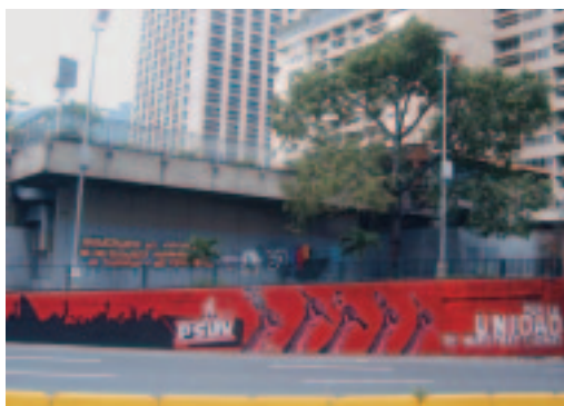
La fresque appelle à construire le Parti socialiste unifié vénézuélien, le parti chaviste hégémonique.

rendent la situation incertaine pour lui. Ces obstacles se sont accumulés devant lui, sans que le Grand Méchant Loup américain y soit pour quelque chose. Mais Chavez est cependant toujours là et les menaces sur la démocratie ne sont pas évanouies au Venezuela par la seule grâce du "non" au référendum. C'est pourquoi la SIDH continuera à suivre ce dossier vénézuélien avec la plus grande attention.