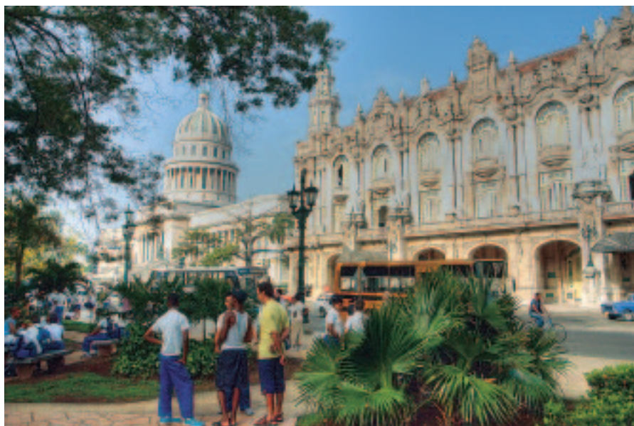
Le Centre de La Havane.

La situation à Cuba n'a pas changé apparemment. C'est ce que répètent, en un sens avec raison, les dissidents sur place, comme Osvaldo Paya ou Vladimiro Roca. Cependant, sous l'apparente immobilité, quelques signes de la lutte pour le pouvoir au sein du Parti communiste se sont faits jour en cette fin d'année 2007. Fidel Castro s'éteint peu à peu, mais il est encore présent et le sera quel que soit le titre qu'il conservera. Président du Conseil d'Etat et du Conseil