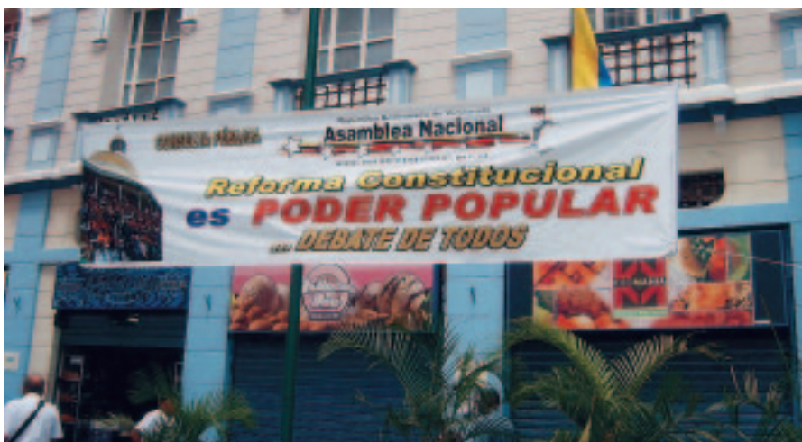
Le "pouvoir populaire" : un moyen de diffuser les idées et les hommes de Chavez.

Manière d'entériner une politique déjà passée dans les faits : il est déjà acquis que deux officiers qui se parlent doivent d'abord se saluer en lançant rituellement : "Le socialisme, la patrie ou la mort". Un copié-collé venu du castrisme. Ajoutons qu'elle aurait une posture de résistance populaire. Manière