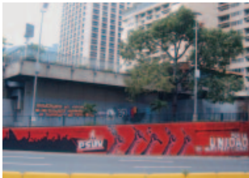
La fresque appelle à construire le Parti socialiste unifié vénézuélien, le parti chaviste hégémonique.

rendent la situation incertaine pour lui. Ces obstacles se sont accumulés devant lui, sans que le Grand Méchant Loup américain y soit pour quelque chose. Mais Chavez est cependant toujours là et les menaces sur la démocratie ne sont pas évanouies au Venezuela par la seule grâce du "non" au référendum. C'est pourquoi la SIDH continuera à suivre ce dossier vénézuélien avec la plus grande attention.