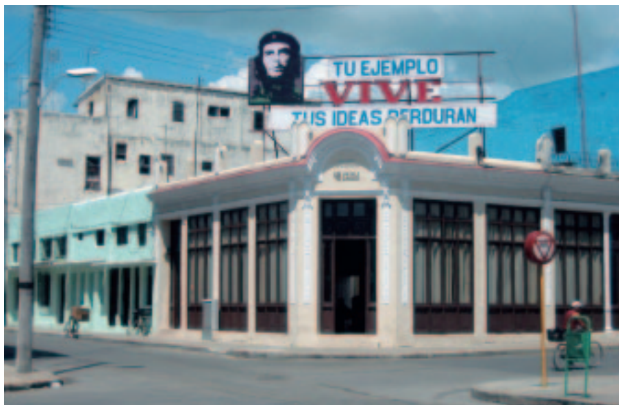
Ton exemple vit – Tes idées perdurent.