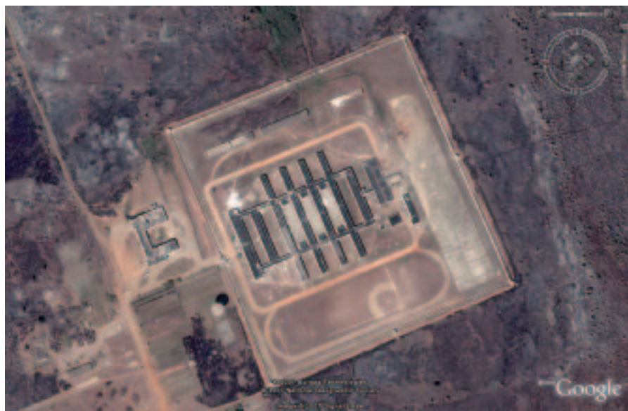
Vue aérienne de la prison de Kilo.

Et voilà que Fidel Castro lui-même, dans une lettre du 18 décembre 2007 évoque la possibilité de laisser le pouvoir à une génération plus jeune ! Sans