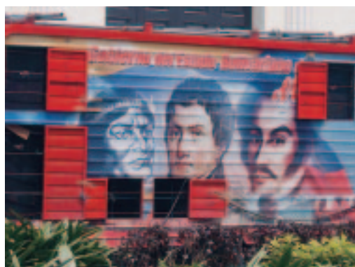
L'Etat se dit "bolivarien".

Après son échec au référendum, Chavez a connu une autre déconfiture, il n'a pu imposer de lui-même une image de médiateur dans les questions des FARC et de leurs otages. Ses appels à la reconnaissance de la dignité des FARC l'ont au contraire positionné comme allié de narco-guérilleros. Les menaces qui planent sur ses plans d'expansion, les difficultés économiques internes,